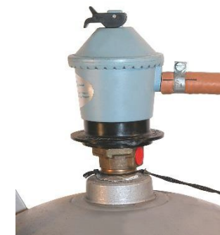
Paineensäädin kiinnitettyä kaasupulloon.

Uusi EN16129 standardin mukainen säädin jossa kytkin on säätimen sivussa.